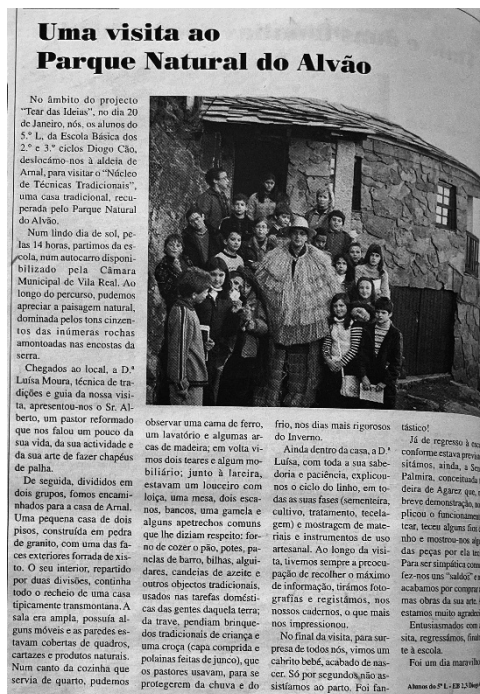
Figura 8: Notícia “Uma visita ao Parque Natural do Alvão”.