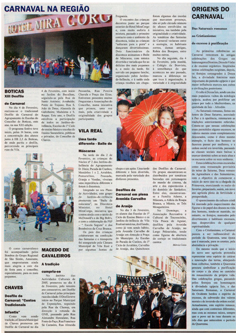
Fonte: Edição nº 173, de 9 de fevereiro de 2005 do Notícias de Vila Real (pág. 6).

Já no ano de 2025, na edição n.º 937, de 19 de fevereiro, foi publicado um total de 13 textos jornalísticos, dos quais três são de caráter cultural, correspondendo a uma percentagem de cobertura de 23,08%.