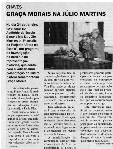
Fonte: Edição nº 172, de 2 de fevereiro de 2005 do Notícias de Vila Real (pág. 17).