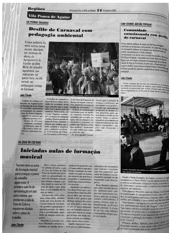
Figura 9: Notícias de cultura em Vila Pouca de Aguiar.