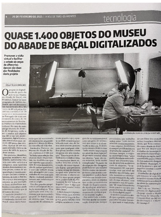
Figura 12: Notícia “Quase 1.400 objetos do museu do Abade de Baçal digitalizados”.