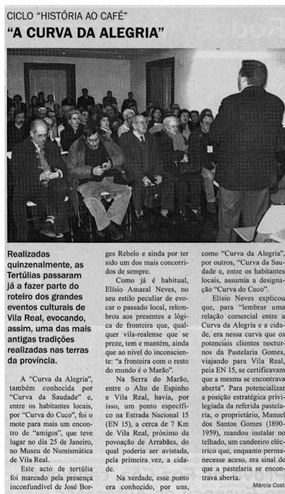
Fonte: Edição nº 172, de 2 de fevereiro de 2005 do Notícias de Vila Real (pág. 17).

Na segunda edição analisada (n.º 173), de 9 de fevereiro de 2005, identificou-se um total de 25 textos jornalísticos, dos quais oito são de carácter cultural, correspondendo a uma percentagem de 28,57%.